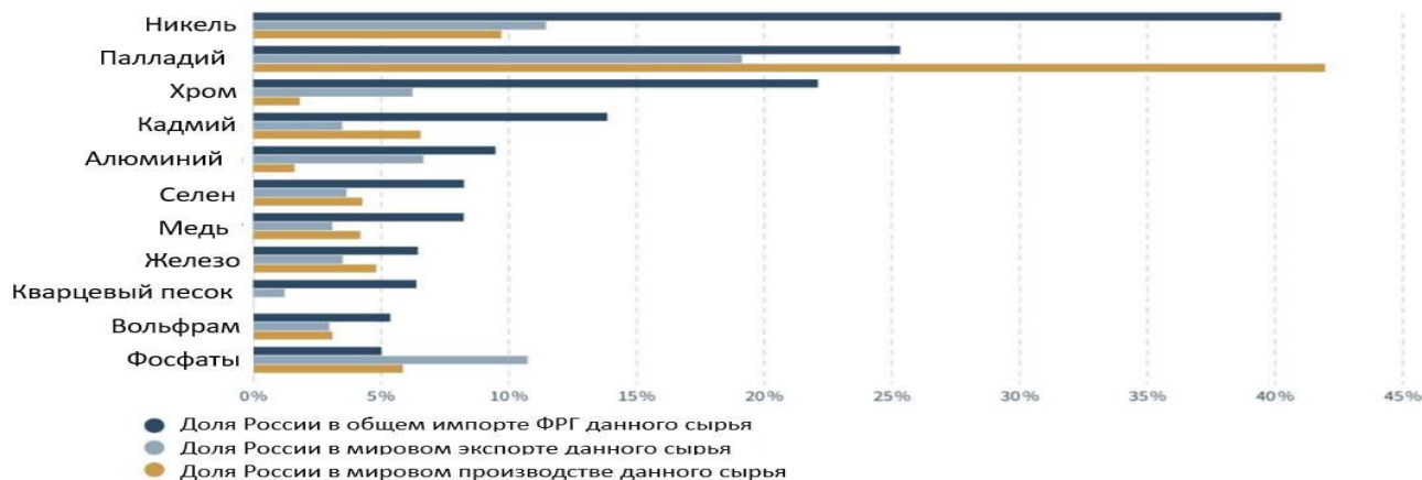
Доля отдельных видов сырья из России в их импорте ФРГ, мировом экспорте и мировой добыче (данные на 2019 г., в %)